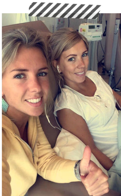
Chemo nummer 3 met m'n zusje.

‘Hebben jullie een kinderwens?’, had de chirurg al snel na de diagnose gevraagd. Toen we daar allebei op antwoorden dat we ooit wel graag kinderen wilden, kwamen we in aanmerking voor een ivf-traject.