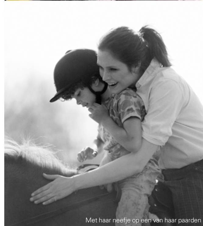
Met haar neefje op een van haar paarden