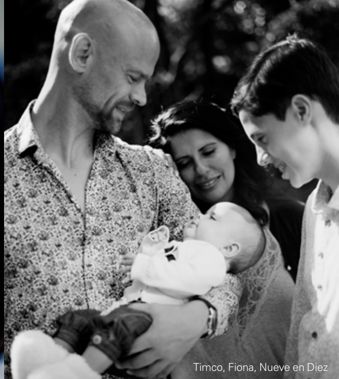
Timco, Fiona, Nueve en Diez